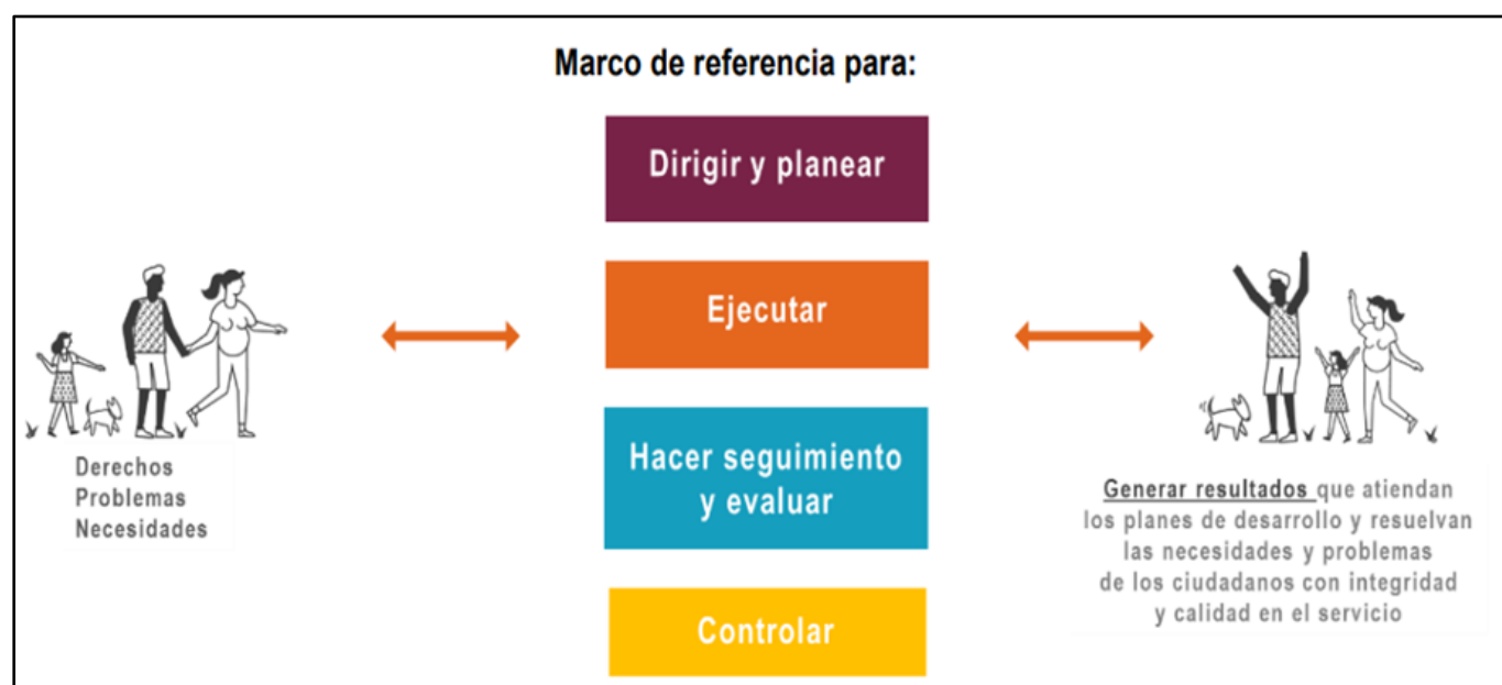
Gráfico 1: Definición del Modelo Integrado de Planeación y Gestión –MIPG

El Modelo Integrado de Planeación y Gestión (MIPG) es el marco de referencia que orienta cómo deben dirigir, planear, ejecutar, hacer seguimiento y controlar su gestión las entidades y organismos públicos. Su propósito es lograr resultados que respondan a los planes de desarrollo y den solución a las necesidades ciudadanas, con integridad y calidad en el servicio.