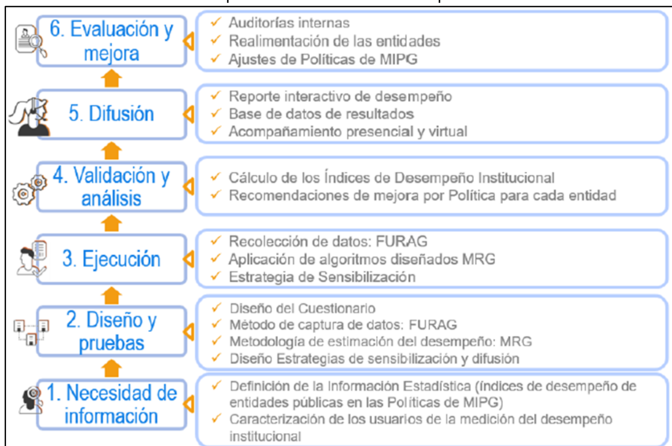
Gráfico 6: Etapas de la medición del desempeño institucional

Este ciclo permite monitorear el avance institucional, orientar los planes de mejora y fortalecer la gestión pública desde una perspectiva basada en resultados.