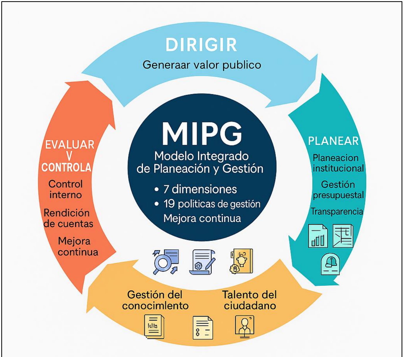
Gráfico 5: Ciclo del MIPG