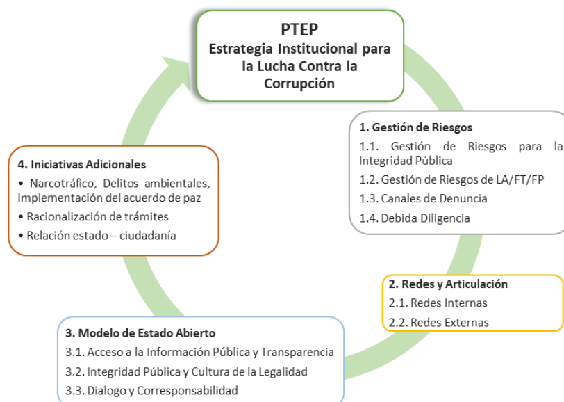
Ilustración 2 Estructura Componente Programático -Estrategia Institucional para la Lucha contra la Corrupción.